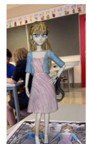
Vi har fargelagt tegninger og sett dem komme til live i appen Quiver

Ellers må jeg bare rose barna deres opp i skyene, altså! Så kreative, morsomme og flotte de alle er! Det er en fryd å få lov til å bli kjent med og dele dagen min med dem <3