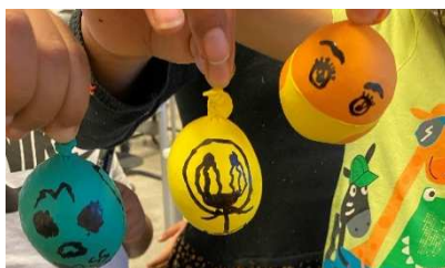
Vi har laget stressbatter med ballonger og ris!

MASSE ros må også gis til alle barna som har vært så utrolig flinke til å følge skolens mobil og -klokke regelement, som tilsier at klokkene og mobilene skal være i sekken i løpet av hele skole- og FRIODagen. Noen har glemt seg innimellom, men det har aldri vært noe problem å legge klokka i sekken etter en påminnelse! 😊 Husk at alle beskjeder må gjennom en voksen på skolen, så hjelp barna deres ved å unngå å ringe til klokkene/mobilene deres, og heller ta kontakt med beskjedtelefonen eller baseleder.